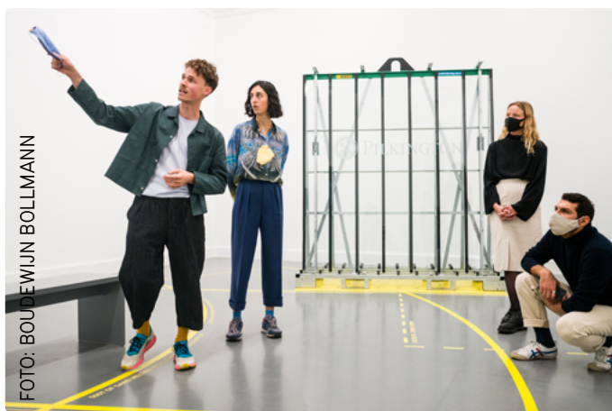
Rondleiding in het Van Abbemuseum langs projecten van Geo-Design / Sand

Het research- en expositieplatform Geo-Design richt zich op nieuwe vormen van onderzoek naar de sociaaleconomische, geografische en geopolitieke krachten die tegenwoordig vorm geven aan het werk van ontwerpers. Door middel van de doorlopende studie wordt design vanuit een onderzoekend perspectief benaderd.