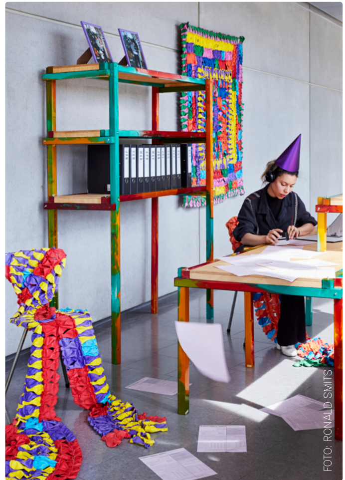
'Happybirthdayto.[name]', afstudeerproject van Noelle van den Dungen

In verband met de pandemie werd studenten de kans geboden hun examen naar eind augustus te verplaatsen. Toch kozen vijf masterstudenten ervoor al op 23 juni deel te nemen aan een online-examen. Alle vijf slaagden en één student ontving zelfs cum laude. De andere stu-