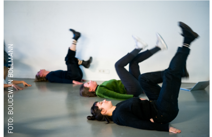
Studenten doen een oefening tijdens Meet the Masters

De recente ontwikkelingen rond seksisme, racisme en intimidatie in het kunstonderwijs heeft bijgedragen aan een aanscherping van het beleid op dit vlak (zie ook 1.4). De handleiding Veilig werken en studeren aan DAE is herzien en kreeg in 2020 de vorm van een Code of Conduct. Daarin treffen studenten, docenten en medewerkers de route voor het melden van misstanden binnen DAE.