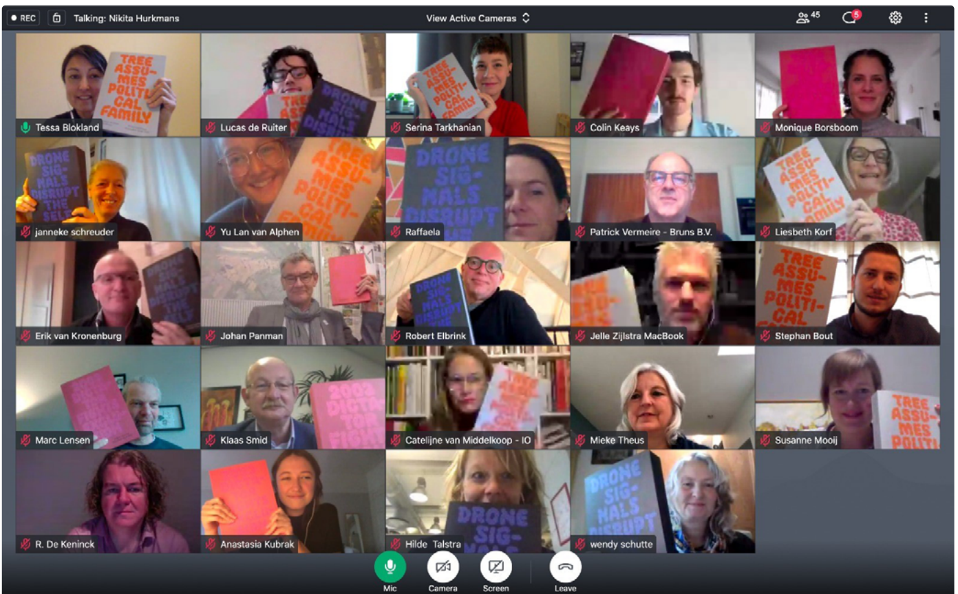
Het Vriendenontbijt dat normaal tijdens de Graduation Show plaatsvindt, werd dit jaar online gehouden