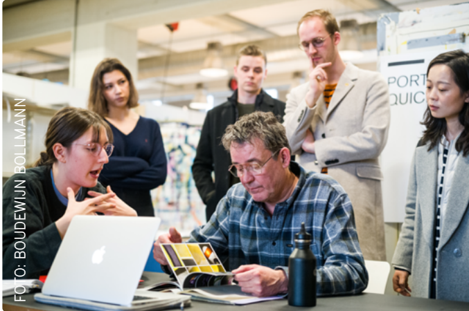
Tijdens de open dag kunnen geïnteresseerde kandidaat-studenten hun portfolio laten beoordelen door een van de docenten

Vanaf maart zijn alle toelatingsgesprekken noodgedwongen online gevoerd. Weinig ideaal, gezien het belang dat een fysieke ontmoeting heeft voor het inschatten van kandidaten, maar in 2020 onvermijdelijk. Het is gelukt een online variant van de toelatingsgesprekken vorm te geven waarbij een commissie van twee docenten met elke kandidaat sprak. Het resulteerde in een goede instroom van nieuwe eerstejaarsstudenten en in het besluit deze vorm van toelating ook in 2021 te gebruiken.