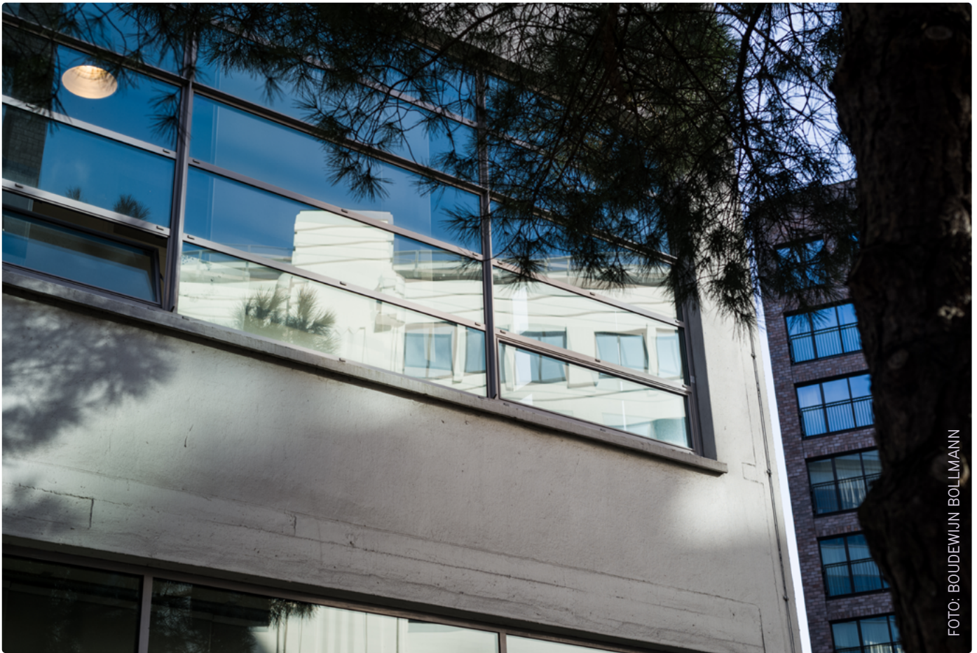
De Witte Dame, het gebouw waar Design Academy Eindhoven in gehuisvest is