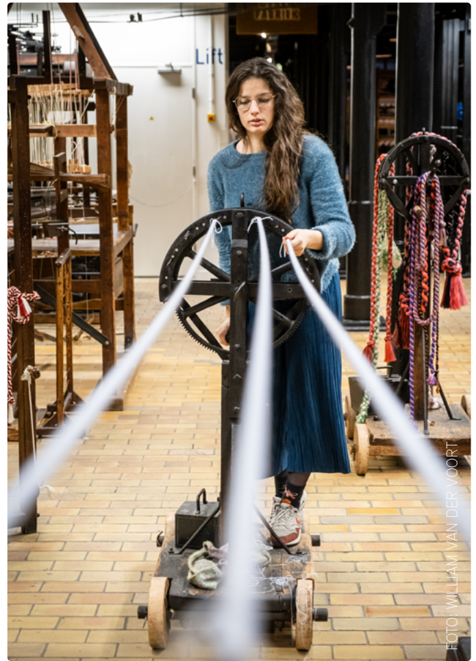
Derdejaarsstudente aan het werk in het TextielLab van het Textielmuseum

Twee evenementen konden geen doorgang vinden: de open dag in juni en de voorlichting tijdens de Graduation Show.