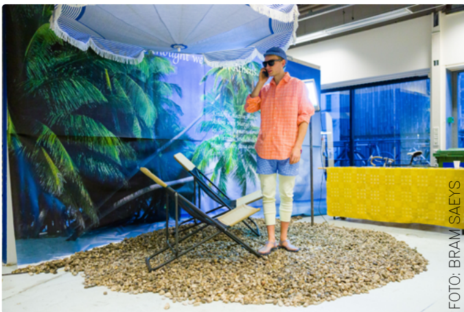
Derdejaarsstudent presenteert zijn eindproject voor een van de minors

In 2020 werd Parsons School of Design | The New School in New York een partnerschool van DAE. De Oslo School of Architecture and Design is door de International Desk ontvangen en rondgeleid.